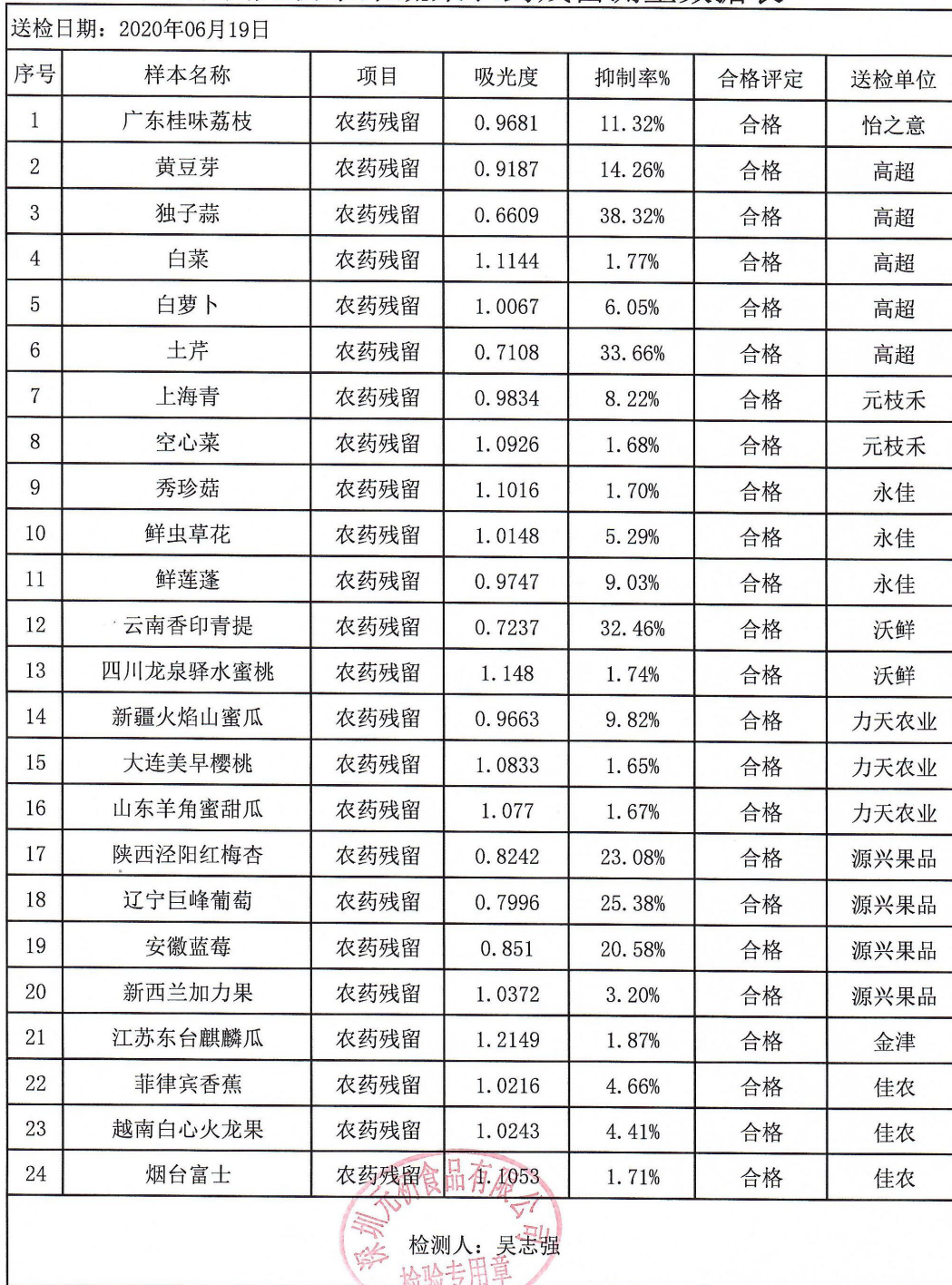
深圳元初水果蔬菜农药残留测量数据表